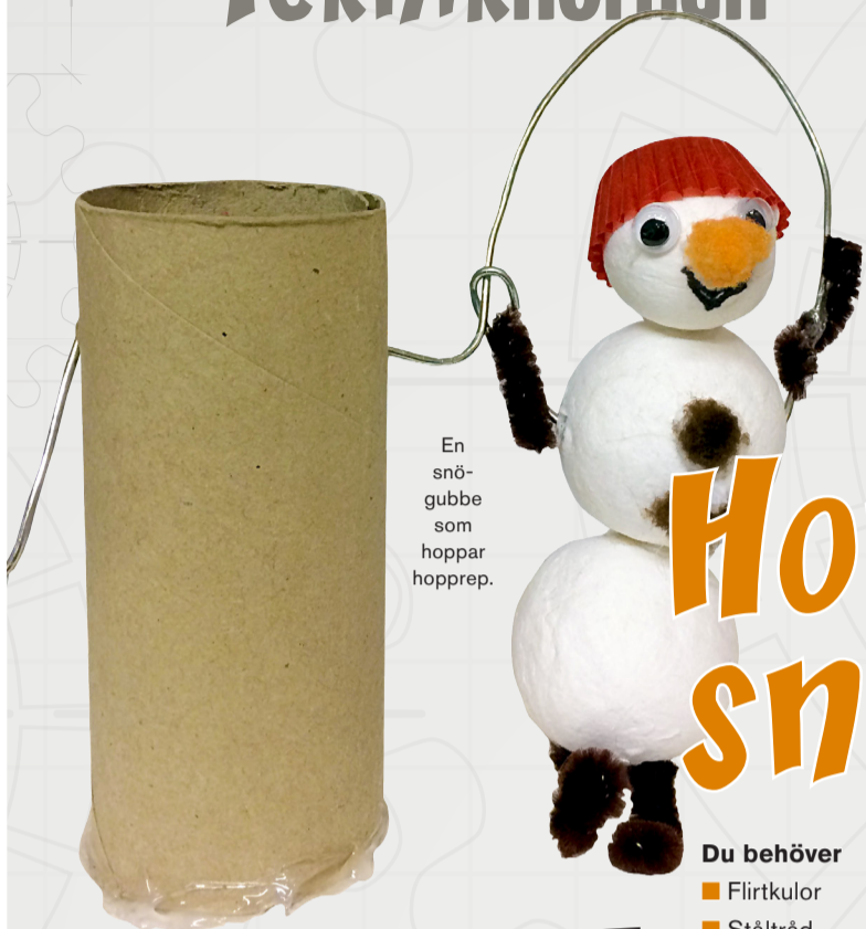
En snögubbe som hoppar hopprep.